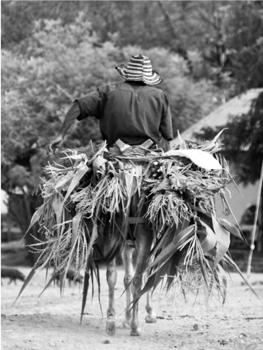
Oliver Emigh/Fundación Semana