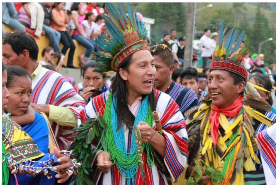
Fotografía del Carnaval de Perdón tomada por Julián Rinaudo.

Los Ingas mantienen un fuerte proceso organizativo, que les ha permitido generar una importante incidencia social y política en la región e incluso en las zonas urbanas en donde se han asentado. Su tradición viajera y comerciante ha sido un importante factor de visibilización y reconocimiento a su cultura, particularmente en relación a la producción de artesanías y remeidos a base de plantas para el tratamiento de una gran variedad de patologías. La difusión del uso de yage en las ciudades con población no indígena se ha convertido en una de las herramientas de visibilización y reconocimiento de mayor impacto, pues propicia espacios de encuentro, diálogo intercultural y aprendizaje, además de la difusión de no solo la cultura ingana, sino la indígena en general.