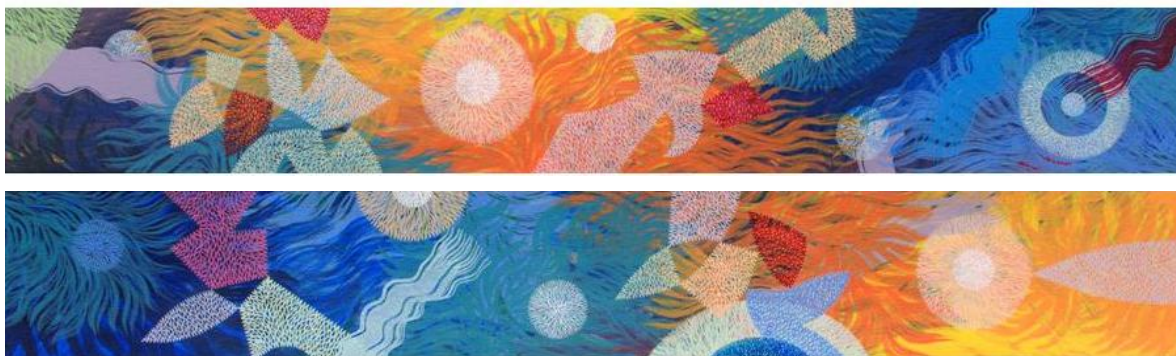
Benjamin Jacanamijoy Tisoy (Uaira Uaua: Hijo del Viento). (2009). Flor de Luna . Acrílico sobre lienzo. 12 x 80 cm c/u.

Por otro lado, el desplazamiento forzado ha hecho que varios miembros de la comunidad se hayan desplazado hacia zonas urbanas del país. Tal es el caso de los ochocientos indígenas que se asentaron posteriormente en Bogotá en la localidad de Antonio Nariño desde 1999 (Observatorio del Programa Presidencial para los DH y el DIH, 2009).