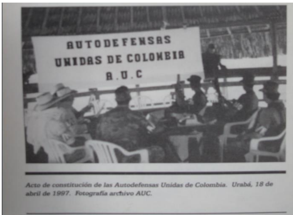
Foto. Reunión de comandantes paramilitares en Urabá, 18 de abril de 1997