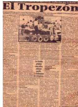
Artículo Periodístico: Crónicas y documentos secretos de los operativos por la Red 07 - “El Tropezón” / Periódico La Tarde. (31 de Julio - 07 de Agosto de 2002 Barrancabermeja.