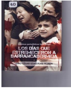
Libro: “Los días que estremecieron a Barrancabermeja” . (Diro Cesar González Tejada).