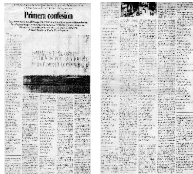
Artículo Periodístico: “Primera Confesión” - La Prensa País / Reproduce: Unión Sindical Obrera - U.S.O (Martes 4 de Enero de 1994).