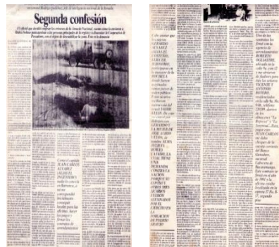
Artículo Periodístico: “Segunda Confesión” - La Prensa País / Reproduce: Unión Sindical Obrera - U.S.O (Martes 4 de Enero de 1994).